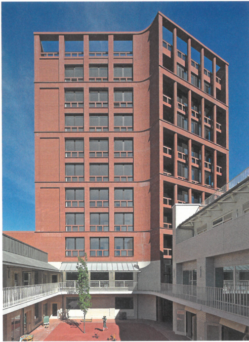
Im Schatten eines polygonalen Wohnturms liegt eine Primarschule. Henley Halebrown haben im Londoner Osten ihren Schulcampus erweitert. → S. 64